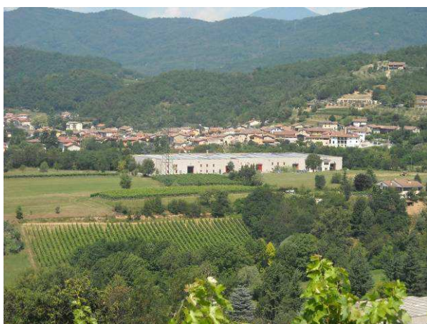
Immagine - Seminativi interstiziali ad altre colture e urbanizzato

I seminativi sono presenti in quantità minore rispetto alla vite e localizzati nell'area sud-ovest del Comune di Ome, a sud del centro abitato di Cerezzata, anche interstiziali in taluni casi all'edificato urbano o frammisti ad altre componenti. Queste aree aprono spesso scorci visuali di notevole interesse sulla parte montana del territorio.