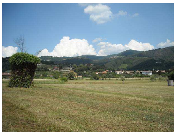
Immagine - Visuale dall'area seminativa verso i rilievi

Tutto il sistema colturale è legato da una maglia di strade poderali (tracciati che, partendo dalla viabilità pubblica, portano alle unità poderali servendo un numero limitato di persone e generalmente si interrompono senza proseguire) e di filari alberati posti lungo esse o sparsi nelle aree agricole, mentre è quasi nullo il reticolo idrico di rogge e canali d'irrigazione. Nelle cartografie si sono inseriti i filari ad uliveto e a vigneto in quei casi dove la coltivazione si limitava a sporadici esemplari che meritavano di essere riconosciuti ma che il numero esiguo non andava a costituire una superficie sufficiente per identificarla come un appezzamento.