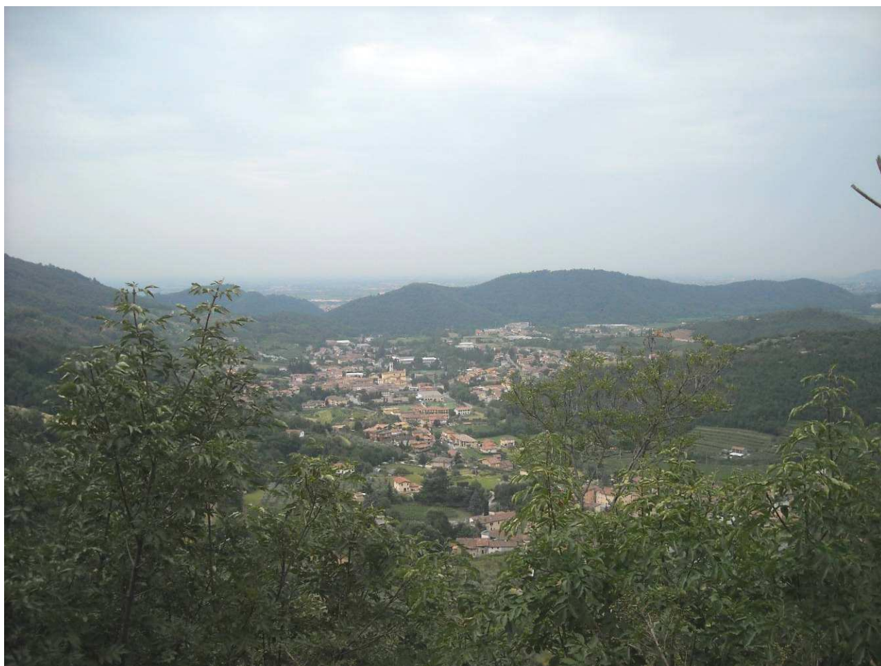
Immagine - Vista panoramica della parte meridionale del Comune

Questa scomposizione consente di procedere in modo dettagliato verso la classificazione e la valutazione del territorio: in conseguenza dell'analisi paesistica ed in considerazione delle caratteristiche fisiche e percettive proprie di ogni componente, viene predisposta una specifica cartografia di sintesi finale per localizzare gli ambiti caratterizzati da maggiore interesse paesistico e soggetti a specifica attenzione nel processo di sviluppo edilizio locale.