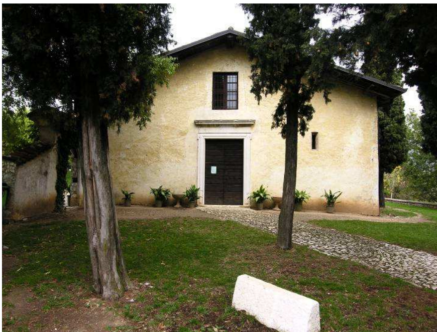
Immagine - La chiesa di San Michele

E' posta all'interno di un recinto in muratura, resto di un'attrezzata area militare-civile-religiosa longobarda (sec. VII-XI). E' un ottimo osservatorio dell'area sottostante e della viabilità che da Rodengo e Camignone, attraverso la Valle di Ome, porta alla Val Trompia e Val Camonica.