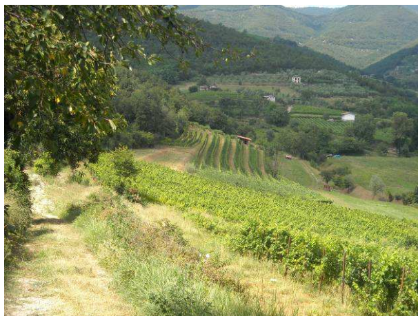
Immagine - Vigneti

L'analisi del paesaggio rivela una parte considerevole di area agricola occupata da prati stabili a ciclo poliennale: le colture a seminativo irriguo a ciclo annuale sono quasi del tutto assenti, mentre sono state rilevate alcune aree a frutteto.