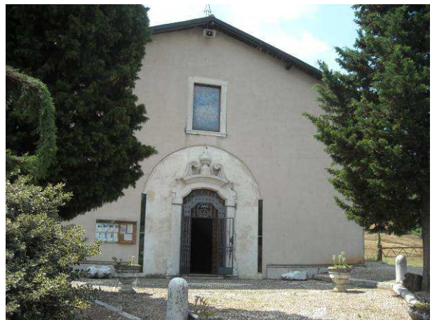
Immagine - Santuario della Madonna dell'Avello