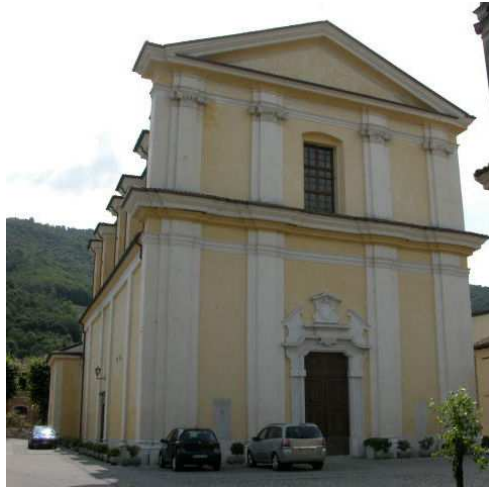
Immagine - La parrocchiale di Santo Stefano

La chiesa di Santo Stefano, di antiche origini, è stata costruita il 15 giugno 1693 sulle fondamenta della chiesa del Quattrocento e restaurata nel 1884-85. Al suo interno custodisce affreschi del 1400 mentre l'altare del SS.mo Sacramento accoglie splendidi marmi policromi. Conserva pregevoli opere quali l'altare e il tabernacolo dei Callegari ('700); la cantoria e la cassa d'organo, mirabile opera d'intaglio di Andrea Fantoni (1656-1734) che scolpì anche alcune statue del settecentesco altare maggiore, opera del Barboncini.