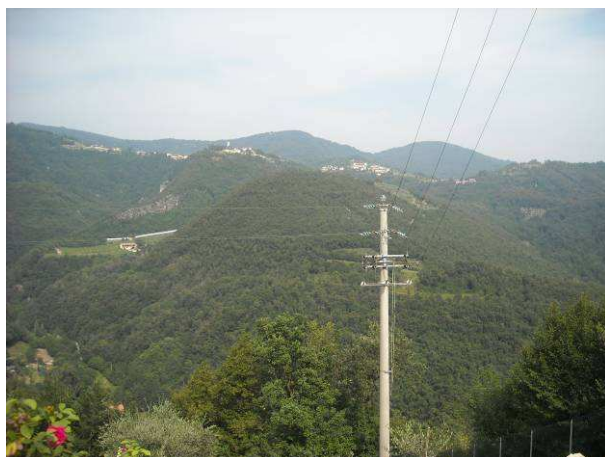
Immagine - Vista sistema Prealpino

Il territorio è segnato dalla presenza di due torrenti principali, che corrono da nord a sud, il Gandovere, il Martignago e da diversi torrenti minori. I corsi d'acqua che incidono il settore montuoso del territorio sono caratterizzati da un regime di tipo torrentizio con grosse piene nei periodi piovosi e magre accentuate nei periodi secchi. La loro presenza ha significativamente inciso il territorio comunale erodendo nei millenni i rilievi e creando alcune piccole valli laterali alla conca di Ome, come la Valle della Cornola, del Fico, delle Artegane, dei Morandi, dei Locchi.