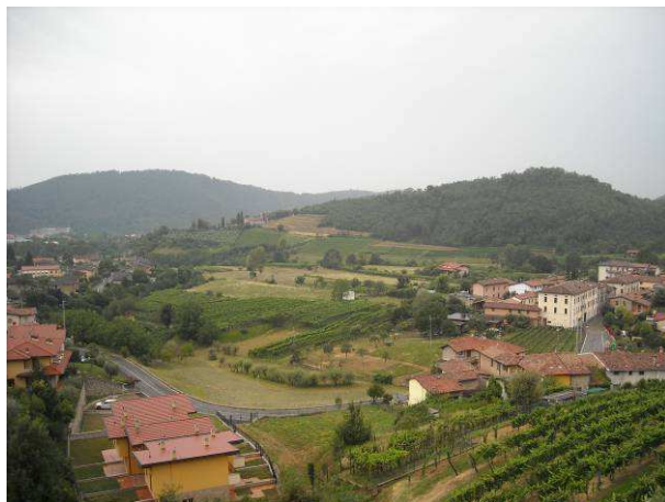
Immagine - Punti visivi sul Santuario della Madonna dell'Avello