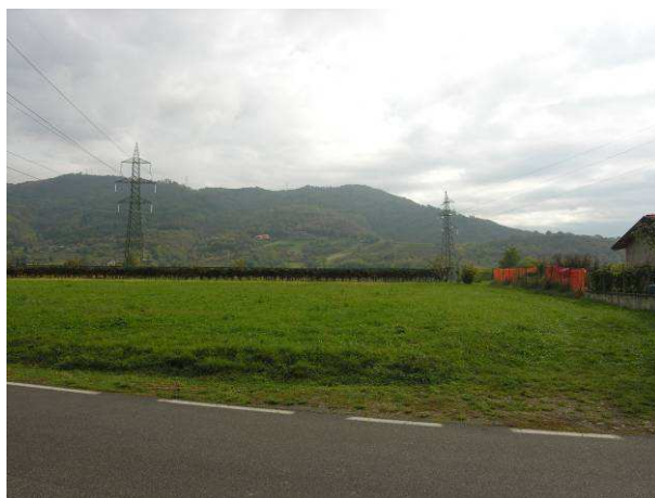
Immagine - Linee elettriche

La rete viabilistica non ha impatto paesaggistico vista l'assenza di viadotti o muri di contenimento, anzi spesso riprende tracciati storici senza intaccare la trama agricola o i versanti; il territorio è attraversato da piste ciclopedonali di interesse sovralocale, infatti il Piano dei servizi prevede il completamento di alcuni tracciati (ciclopedonale "Valeriana" e "Meridiana") poiché si ritiene importante promuovere, a scopo turistico, la riscoperta di tracciati sterrati poco battuti che collegano il capoluogo alle frazioni circostanti di altissimo valore paesaggistico.