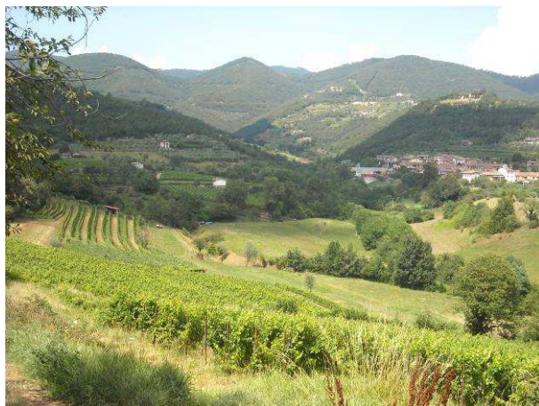
Immagine - Punti visivi sulla Chiesa di San Michele