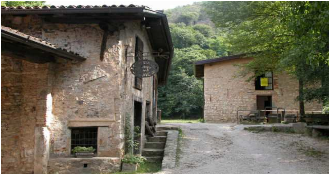
Immagine - Maglio Averoldi

Il Maglio Averoldi è di proprietà Comunale ed è stato oggetto di recente ristrutturazione; vengono altresì periodicamente organizzate dimostrazioni sulla lavorazione del ferro con la tecnica del damasco. Tale iniziativa ha riscontrato molto interesse sia a livello provinciale che nazionale.