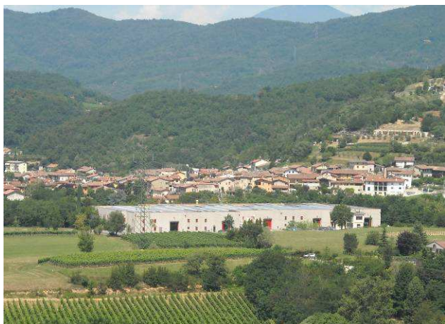
Immagine - Area produttiva

La tavola T04 individua, quali componenti di degrado del paesaggio, gli elementi la cui presenza comporta un'alterazione importante, generalmente dotata di un connotato negativo, nell'ambito del paesaggio tipico del territorio esaminato. Si tratta, in genere, di elementi quali le aree produttive localizzate a sud del Comune, soprattutto a ridosso della S.P. 46. Tuttavia esistono alcune aree produttive isolate che generano, anch'esse, situazioni di degrado paesistico a ridosso di ambiti residenziali, e nuclei storici. Lo stabilimento produttivo di legname a ridosso della frazione di Cerezzata è il caso più emblematico.