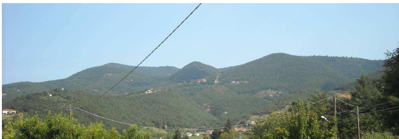
Immagine - Vista sulle aree boscate che ricoprono i versanti

Le aree boscate coprono in buona parte il territorio Comunale e lungo i percorsi dei due torrenti principali è possibile rilevare la presenza di vegetazione qualora arbustiva a cespuglieto, qualora arbustiva arborea. Sono presenti una discreta quantità di superfici agrarie destinate a prato stabile, spesso rintracciabili nelle aree disboscate o in via di rinaturalizzazione di transizione al bosco.