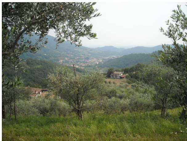
Immagine - Vista dalle colline meridionali del Comune di Ome