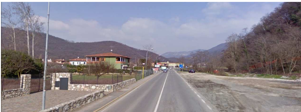
Immagine - Vista dei rilievi di Ome dal Comune di Rodengo Saiano

La percezione paesistica definisce un territorio immerso in un anfiteatro di colline che precedono visivamente l'ambiente prealpino posto in secondo piano, pertanto il paesaggio risulta ad alta sensibilità percettiva.