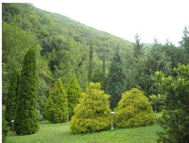
Immagine - Orto botanico delle conifere coltivate