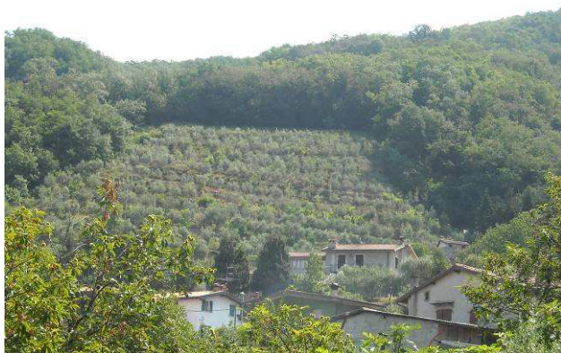
Immagine – Uliveti