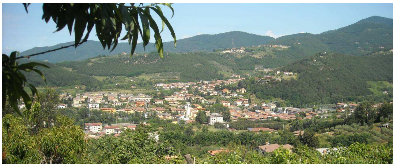
Immagine - Vista dell'edificazione residenziale

Fa eccezione l'area residenziale "Villaggio Marcolini", a sud – ovest del nucleo storico del Centro di Ome, sviluppatosi sul "dosso" sovrastante il nucleo storico attorno gli anni 60 – 70, senza un concreto e definito progetto urbanistico unitario: la viabilità e le tipologie edilizie appaiono disomogenee rispetto al contesto che le circonda. In anni recenti anche a sud della frazione di Cerezzata, lungo Via Sabbioni, si è progressivamente intensificata l'attività edificatoria a scopo residenziale, saldandosi ormai alla nuova struttura Ospedaliera di "San Rocco".