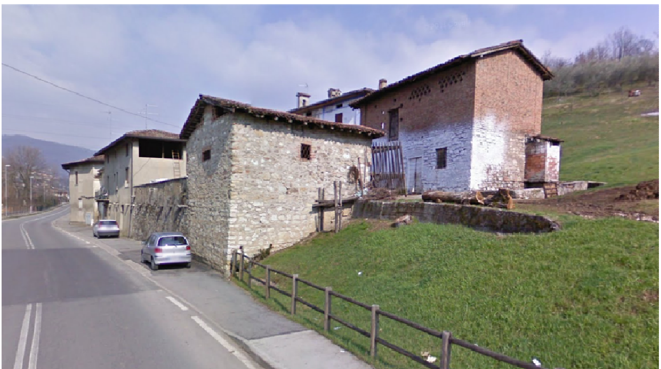
Immagine - Cascina